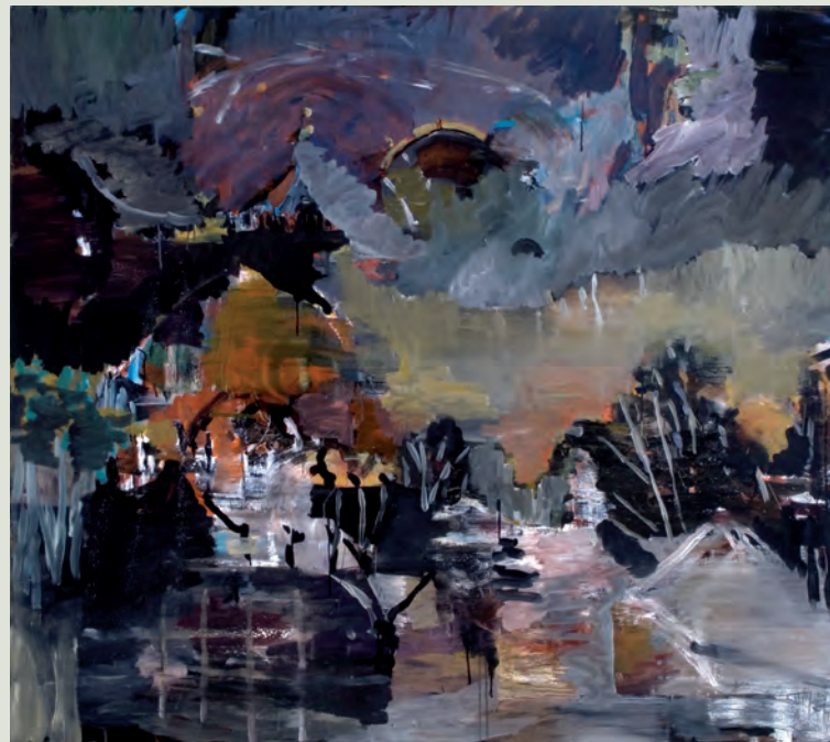
„Rendsburg im April“, 2010, Öl auf Leinwand, 120x150 cm