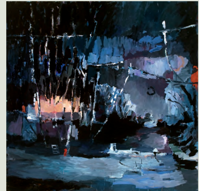
„Die Milchstraße“, 2009, Öl auf Leinwand, 125x125 cm

Vor allem nachts, wenn sein Atelier in Stille und Dunkelheit daliegt, entstehen auf der Leinwand des Künstlers Lutz Bleidorn aus dem Schwarz menschenleere Landschaften. Es sind hochsensible Bildräume, Nachtstücke, in dunkler und doch nie düsterer Farbigkeit, die den Betrachter unmittelbar gefangen nehmen.