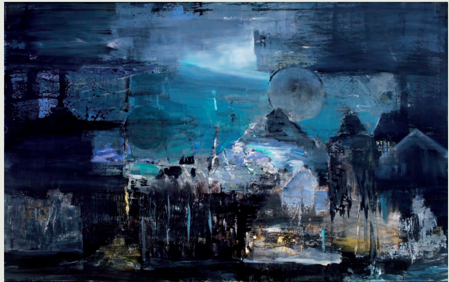
„Ein Unbekannter Ort“, 2010, Öl auf Leinwand, 120x190 cm, Kunstfonds, Staatliche Kunstsammlungen Dresden