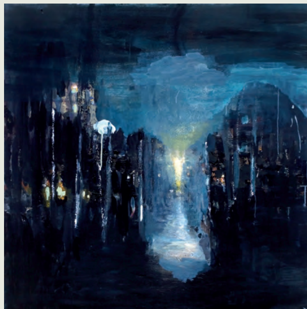
„Im Dezember“, 2010, Öl auf Leinwand, 100x100 cm

Es ist die Landschaft, der sich Lutz Bleidorn fast ausschließlich widmet. Meist sind es ganz konkrete Orte wie bei den Arbeiten „Vor der Stadt“ oder „Im Dezember“, Episoden, real erlebt wie bei „Vater betrachtet eine Himmelserscheinung“ (Öl auf Leinwand, 2009), die der Künstler im Bild einfängt, als wolle er sie auf ewig bannen und so davor bewahren, unwiderruflich zu entrinnen. Nicht selten kehrt ein und derselbe Ort in verschiedenen Darstellungen wieder, muten die Erinnerungen verzerrt und flüchtig an wie Gedankenfetzen, die sich entziehen, bevor sie greifbar werden. Lutz Bleidorn selbst bezeichnet seine Arbeiten als „Innere Bilder“, die erinnerte Wirklichkeit in Verblendung mit phantastischen Szenerien zeigen. Diese überlagern einander so, dass Realität und Illusion verschwimmen. Surreal erheben sich ferne Berge aus dem Nichts.