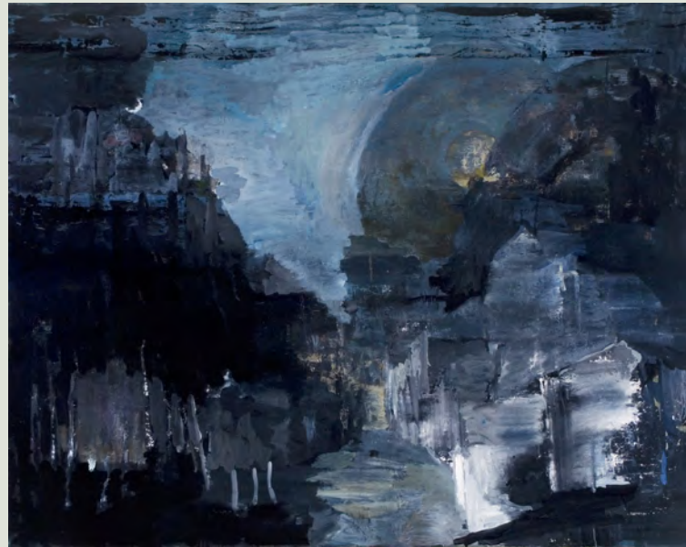
„Vor der Stadt“, 2010, Öl auf Leinwand, 140x110 cm